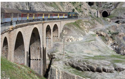
Der Dez entlang in Lorestan

Wir führen die Reise ausschliesslich mit unserem in der Schweiz registrierten, frisch kontrollierten und klimatisierten Club – Reisebussen durch. Dies garantiert optimale Flexibilität und Sicherheit. Immer ist ein Deutsch / Farsi sprechendes Mitglied unseres Clubs auf der Reise dabei. Mit unseren Clubreisen wollen wir unseren Gästen das Land und die Leute von Iran näher bringen. Wir sind nicht gewinnorientiert und können die Reisen dank der vielen Freiwilligenarbeit zu den Selbstkosten anbieten. Günstiger und authentischer können Sie den Iran nicht erleben.