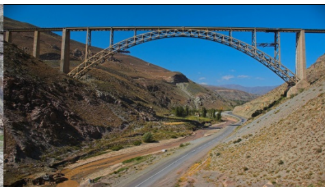
Eisenbahnbrücke in Khoy