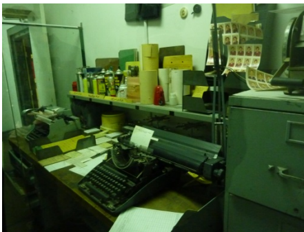
Fälscherwerkstatt amerikanische Botschaft

Mit unseren Clubreisen wollen wir unseren Gästen das Land und die Leute von Iran näher bringen. Wir sind nicht gewinnorientiert und können die Reisen dank der vielen Freiwilligenarbeit unserer Clubmitglieder zu den Selbstkosten anbieten. Günstiger und authentischer können Sie den Iran nicht erleben.