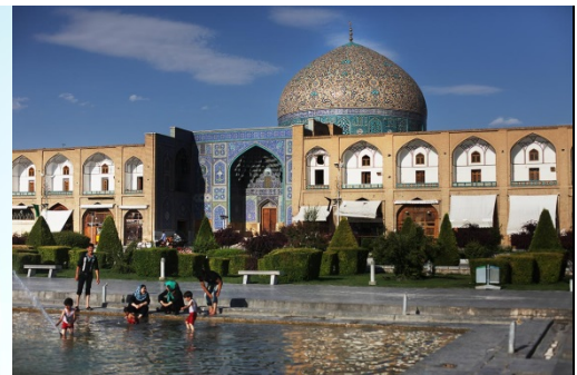
Die halbe Welt in Isfahan