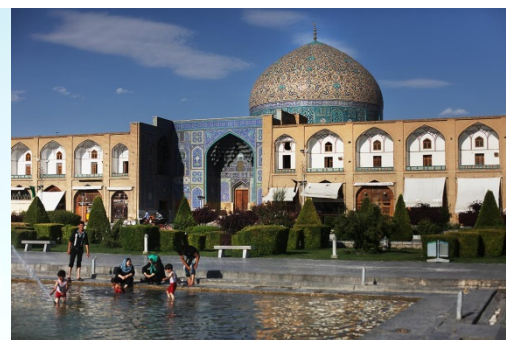
Die halbe Welt in Isfahan